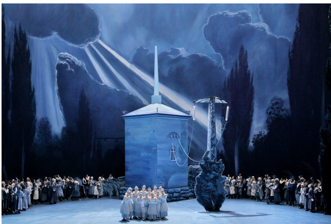
Опера «Лоэнгрин» на сцене Байройтского фештпильхауса

Вагнеровские лейтмотивы — это форма маркировки: запоминающиеся звуковые формулы возникают в устойчивых контекстах и сигнализируют слушателю о персонаже, предмете или идее; фактически — ранние хештеги, которые сегодня структурируют поток информации в электронных медиа. Кроме того, в упрощенном виде вагнеровская лейтмотивная система оказала значительное влияние на искусство киномузыки, став одним из базовых механизмов ее драматургии. Композиторы, работающие в кино, постоянно используют тот же принцип ассоциативной памяти: персонажи и идеи получают собственные темы, что формирует звуковой нарратив, который связывает сюжетные линии и помогает зрителю ориентироваться в них.