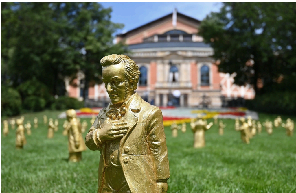
Садовая фигура Рихарда Вагнера перед Байройтским фестивалем